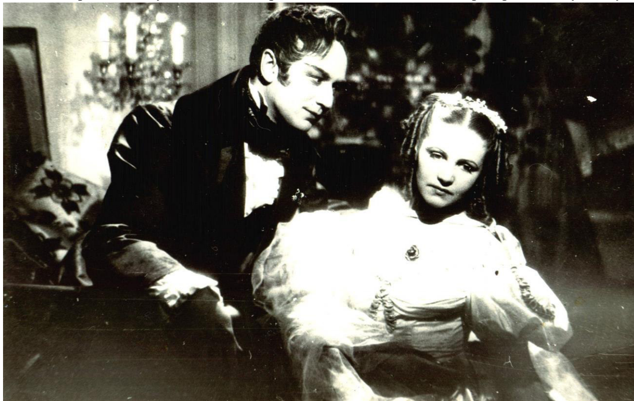
Кинофильм «Маскарад», 1941 г. В ролях: Арбенин – Н. Мордвинов, Нина – Т. Макарова.

Судьбе было угодно связать в единый творческий союз Н. Мордвинова и Ю. Завадского «...В дни становления студии и пришел ко мне Мордвинов. И сразу же понравился своей искренностью, скромностью, увлеченностью театром. И хоть читал он на экзамене провинциально «трагично», и курчавые височки подчеркивали его претенциозность, я поверил, что все это наносное, одолимое, что «материал» он великолепный, что из него выйдет толк», – вспоминал позже Ю. Завадский 6 . Начиная с момента возникновения театра-студии Моссовета на Сретенке, молодой артист Николай Мордвинов сразу заявил о себе замечательными ролями, которые раскрыли огромное богатство его таланта: обаяние, темперамент, смелость в импровизации. Итог этой работы с 1927 по 1935 год – звание народного артиста РСФСР. Это только начало творческого пути Н. Мордвинова – а сколько еще ролей впереди! Перед нами в фотографиях, буклетах, афишах проходят сценические герои Мордвинова – такие разные по характеру, темпераменту: поручик Яровой, Дон Гуан, Петруччио, Отелло, Алпатов, поручик Соболевский, Дик Даджен, Король Лир, Леший, Арбенин... За свою творческую жизнь им было создано 38 театральных образов. И каждой новой роли он отдавал всего себя. Его работы запоминались, на его роли ходили в театр специально, им восхищались. «Интересно, смело играет Мордвинов. Он нашел свой путь к Шекспиру. Его Отелло возбуждает мысль, вызывает споры. Мордвинов исходя не из внешних признаков мужества и благородства Отелло, талантливо раскрыл его душевную