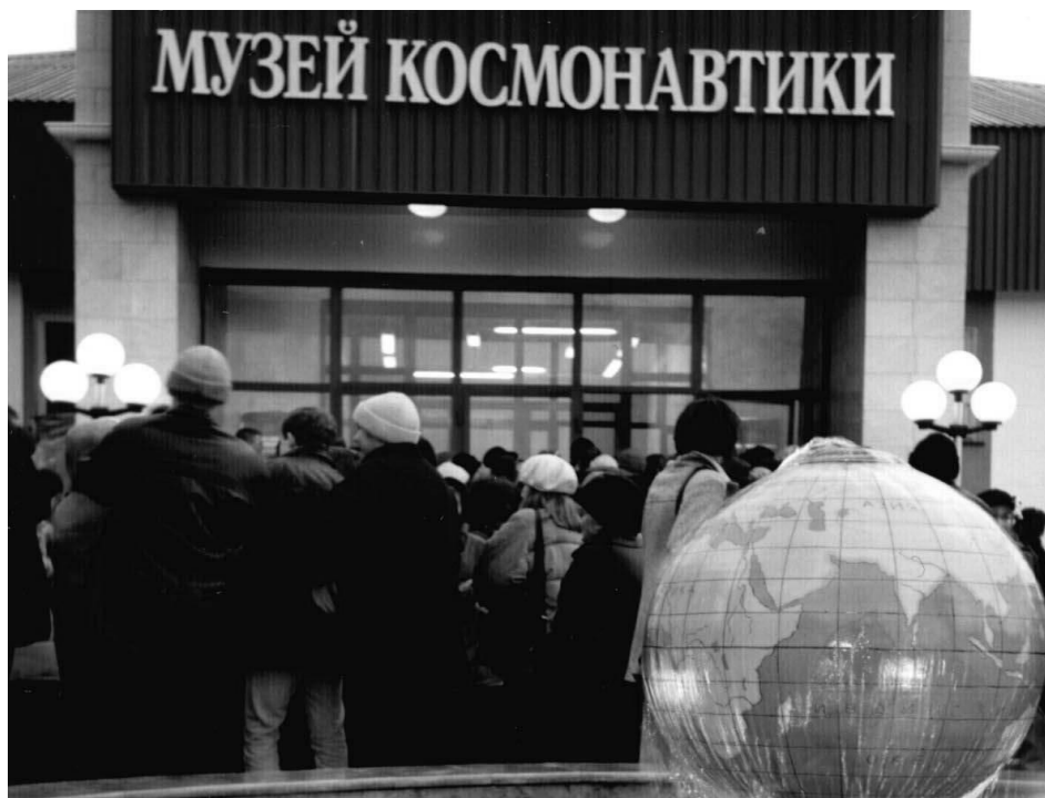
Открытие Музея космонавтики в Шоршелах

«02.12.2001 г. С волнением и большим удовольствием побывал в Вашем космическом музее на родине моего друга – Андрияна Григорьевича Николаева.