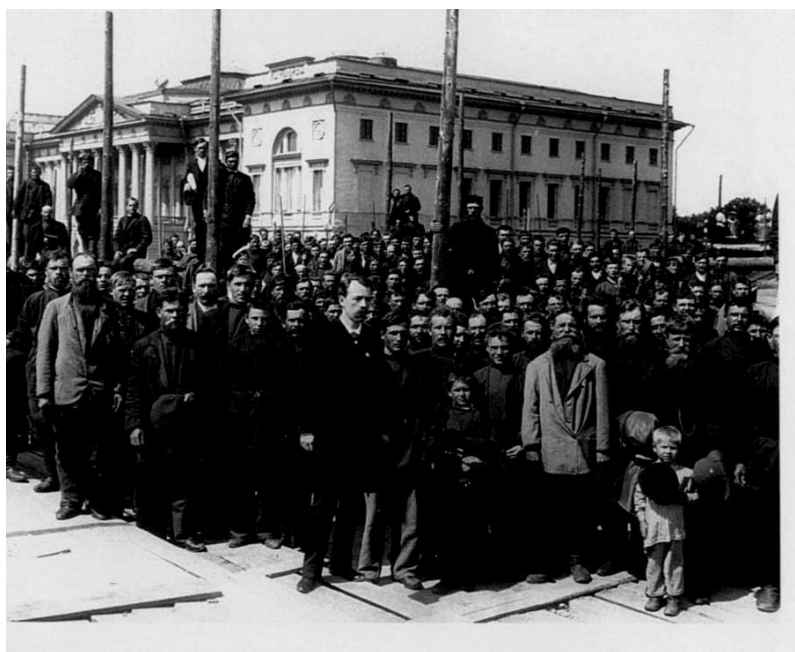
Молебен, посвященный закладке здания этнографического отдела Русского музея. 1905 г.

Коллекционный фонд музея используется не только в чисто исследовательских целях, он необходим и для практической работы. Значительная часть экспонатов по этнографии чувашей использована в экспозиции «Народы Поволжья сер. XIX – нач. XX вв.». Кроме того, экспонаты по этнографии чувашей постоянно включаются в экспозиции стационарных и передвижных выставок. Так, сегодня работает выставка «Люди и вещи», созданная к 100-летию музея и на ней представлены предметы, характеризующие культуру чувашского народа. Экспонаты по этнографии чувашей, особенно предметы женского костюма, привлекающие необычайным изяществом и изысканностью вышивки, и нацио-